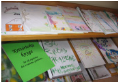
Mokinių kūrybos ir knygų iliustracijų paroda