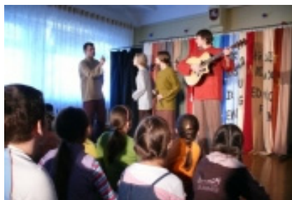
Muzikinis spektaklis „Senelės pasaka“