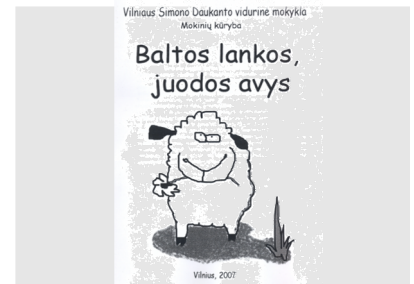
Mokinių kūrybos almanachas